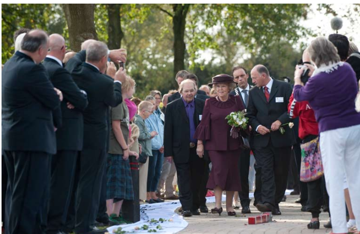
Koningin Beatrix loopt langs de aanwezigen