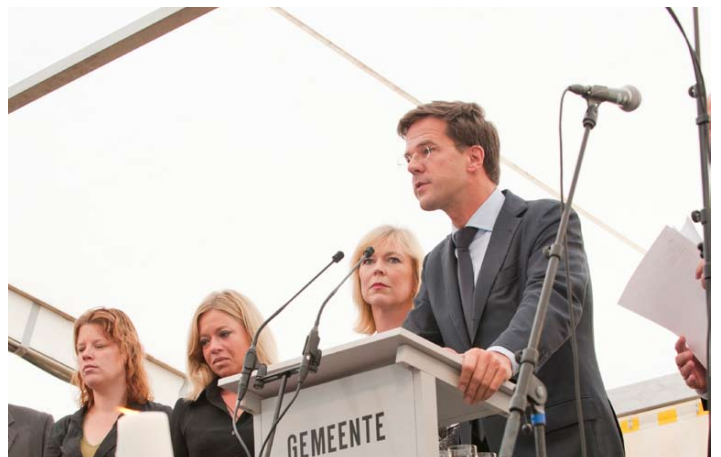
Premier Rutte spreekt de aanwezigen toe